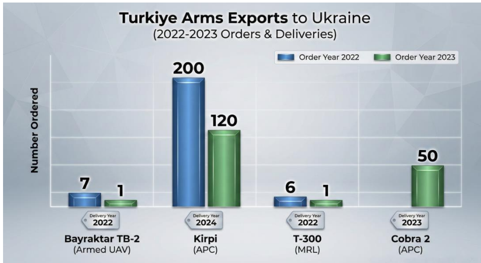
شکل ۱. نمودار صادرات تسلیحات ترکیه به اوکراین در جریان جنگ اوکراین