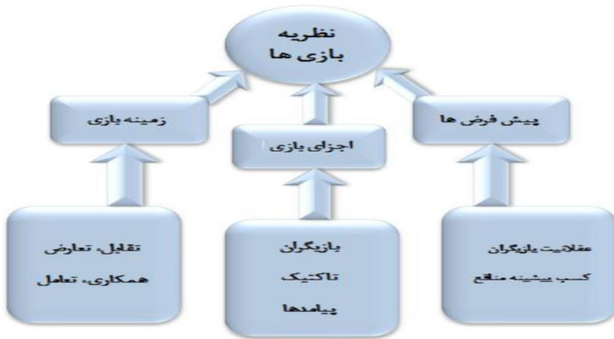
شکل ۱. ابزارهای تحلیل نظریه بازی‌ها