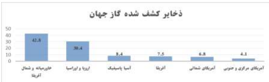
نمودار ۲: ذخایر کشف شده گاز جهان