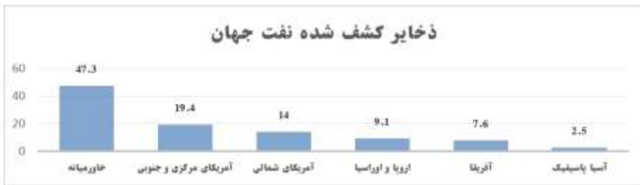
نمودار ۱: ذخایر کشف شده نفت جهان