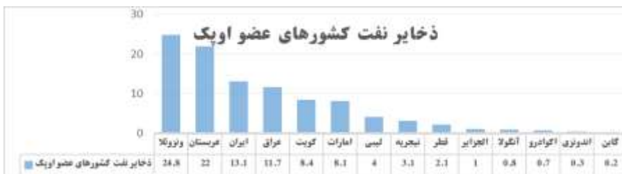
نمودار ۳: ذخایر نفت کشورهای عضو اوپک