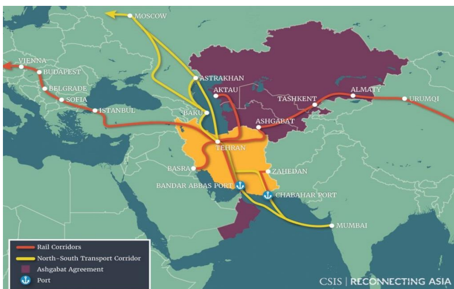
شکل ۲ - کریدور شمال - جنوب (منبع: پایگاه خبری وزارت راه و شهرسازی ۱۳۹۷)

می‌باشد، ایران می‌تواند به عنوان کشوری با نیروی کار و بازار مصرفی عظیم توجه سرمایه‌گذاران عرصه‌های تولیدی را به خود جلب نماید همانگونه که از محورهای اساسی طرح کمربند و جاده و مشارکت برای زیرساخت کیفی آسیایی تسهیل سرمایه‌گذاری و ایجاد مناطق سرمایه‌گذاری مشترک بوده است. گرچه در مورد عدم حضور ایران در طرح کمربند و جاده می‌توان مسیرهای جایگزینی ایجاد نمود اما خروج ایران از طرح کریدور آسیا-آفریقا می‌تواند کل این پروژه را به طور کامل متوقف کند زیرا هیچ مسیر شمال-جنوب دیگری در دسترس نخواهد بود، اما حضور ایران در این طرح می‌تواند گسترش همکاریها و ارائه کمکهای مالی و زیرساختی و حجم انبوه فناوریهای روز زیرساختی جهان را به ایران روانه سازد؛ طرحی که اجرایی شدن آن می‌تواند دستیابی به بازاری وسوسه‌انگیز را برای ژاپن تداعی سازد و همچنین عاملی در راستای کسب هر چه بیشتر منافع ملی جمهوری اسلامی ایران به شمار آید.