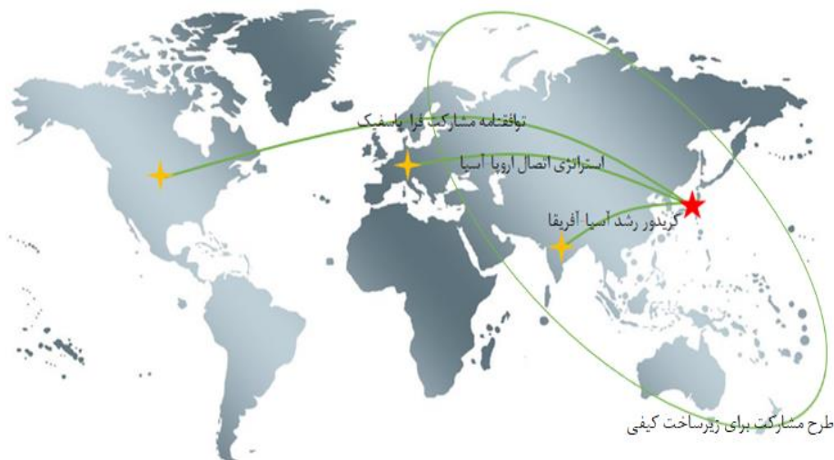
شکل ۱- مجموعه استراتژی‌های ژاپن در قبال طرح کمربند و جاده

گرچه بررسی موشکافانه این طرح‌ها خود نیازمند پژوهشی مستقل می‌باشد لیکن مشخصات کلی این طرح‌ها مختصراً ذکر می‌گردد تا بتوانیم در ادامه به بررسی دقیقی از حوزه‌های همکاری جمهوری اسلامی ایران در هر یک از این طرح‌ها بپردازیم.